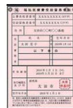
●福祉医療費受給資格者証