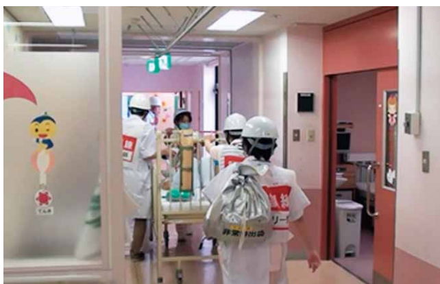
第一病棟 最後の患者避難