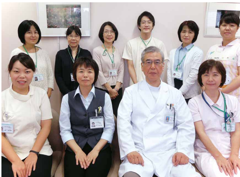
母子保健室のスタッフ